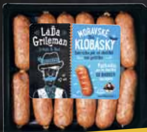
MORAVSKÉ KLOBÁSKY 450g

A DALŠÍ A DALŠÍ SKVĚLÉ VYCHYTÁVKY OD LÁDI GRILEMANA