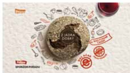
3. Postupně pak nakreslí piktogramy "Bez soli" a "Nesycený" a zrnit. Hudba se stýká do šu. Tónový 5-7"