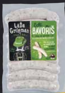
ECHT BAVORIŠ 180g