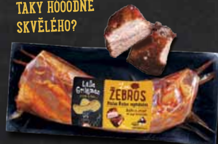
LOS ŽEBROS cca 750g

NEBO NĚCO JINÉHO? TAKY HÓÓÓDNĚ SKVĚLÉHO?