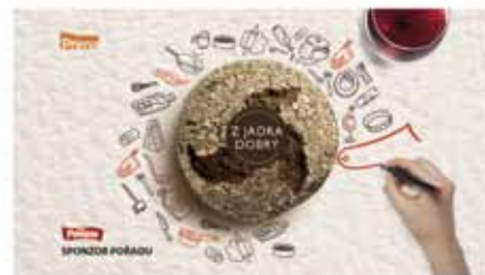
2. Člověk se nakresluje. Červený důlček (více žit) se do důlčků z bílého a žlutého kreslí stávkou a text "Hodjichani chléb". Postupně pak nakreslí piktogramy "Bez soli" a "Nesycený". Hudba se stýká do šu. Tónový 2-4"