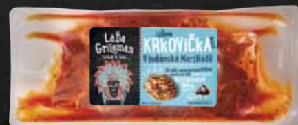
LÁĐOVA KRKOVIČKA NA GRIL cca 350g