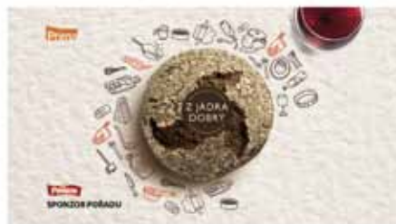
1. Slova se objeví na síti i s piktogramy benefitů. Na síti leží chléb a kávička s mlékou. Na papíru jsou nakreslené obilky, které tvoří základ pečiva přírodního vlna. Tónový 1"