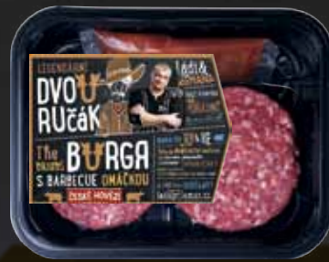
HOVĚZÍ DVOURUČÁK 400g