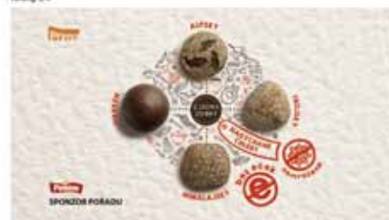
4. Člověk se vlní a chléb. VO: Z jádra dobrý chléb. Tónový 8-10"

a chléb Darken), ve kterých je vždy něco jedinečného a navíc jsou zcela bez přídavných látek. Po úspěšném zalistování do obchodních řetězců byla pečlivě naplánována mediální kampaň, jejíž součástí byla TV podpora výrobků, a to formou sponzorského vzkazu u oblíbené soutěže o vaření Prostřeno na TV Prima. Základní myšlenka kampaně je: „Ať už v životě plánujete cokoli, užijte si z jádra dobrý den s naším pečivem, tedy