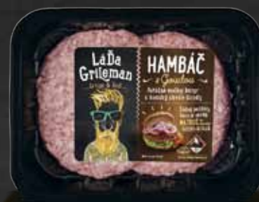
HAMBÁČ S GOUDOU 350g

NEBO NĚCO JINÉHO? TAKY HÓÓÓDNĚ SKVĚLÉHO?