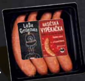
HASIČSKÁ VYPEKAČKA 450g