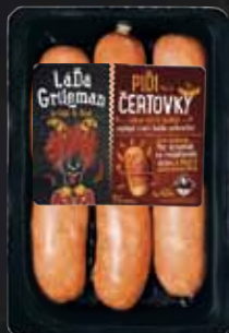
PIDI ČERTOVKY 250g