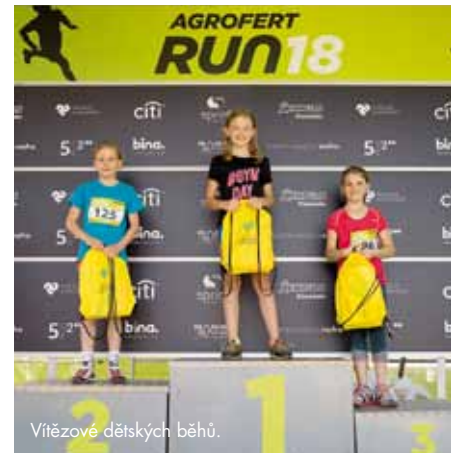
Vítězové dětských běhů.