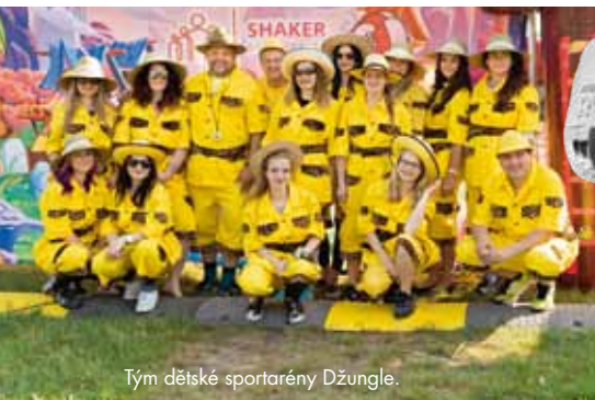
Tým dětské sportarény Džungle.

Sobota 12. května nabídla slunečný den a tradiční sportovní program seriálu Agrofert Run jak pro rodiny s dětmi, tak i pro dospělé. Pro děti jsme připravili novinku v podobě sport arény Džungle, ve které si každý mohl vyzkoušet různé sportovní disciplíny. Za jejich absolvování získal body do hrací karty, které