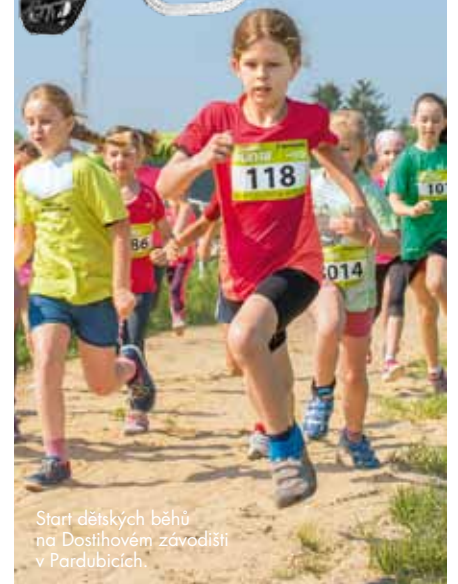
Start dětských běhů na Dostihovém závodišti v Pardubicích.

Synthesia Agrofert Run se po úspěšných třech ročnících běžel již počtvrté. Upravili jsme oblíbenou trasu hlavního závodu z předchozích