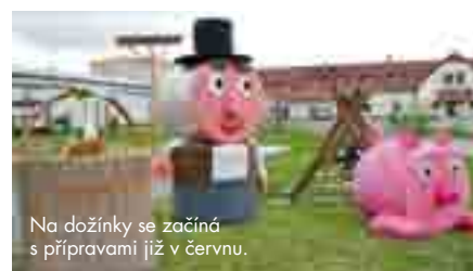
Na dožínky se začíná s přípravami již v červnu.