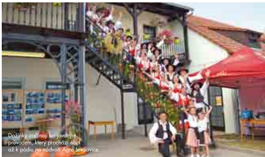
Dožínky začínají krojovaným průvodem, který prochází obcí až k pódiu na nádvoří Agro Jevišovice.

Moje hlavní pracovní náplň je personalistika a mzdy. Zábavu neumím a ani nechci dělat