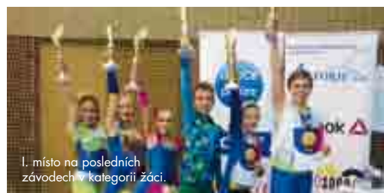
I. místo na posledních závodech v kategorii žáci.