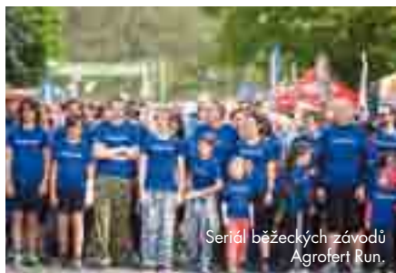
Seriál běžeckých závodů Agrofert Run.

Náš marketingový rok začal v březnu v Hu- debním divadle Karlín, kde jsme jako generál- ní partner muzikálu Karla Gotta odstartovali naše pětileté partnerství s muzikálem Čas růží. Na příští rok pro vás všechny připravujeme soutěže o vstupenky na toto představení. V dubnu začal seriál běžeckých závodů, kte- ré postupně budujeme, a tvoříme tak silnou značku ve sportovním světě. Těší nás, že me- ziročně zájem o Agrofert Run neustále roste, a proto jsme se rozhodli rozšířit ho v příštím