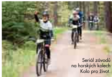
Seriál závodů na horských kolech Kolo pro život.

Když už se bavíme o sportu, tak nesmíme za- pomenout, že jsme letos značku Agrofert drželi v dobré cyklistické kondici a byli jsme generál- ním dodavatelem seriálu závodů na horských kolech – Kolo pro život. V příštím roce budete mít stále možnost startovat na tomto cyklistic- kém seriálu, startovně pro vás opět zajistíme!