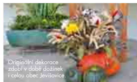
Originální dekorace zdobí v době dožínek i celou obec Jevišovice.

ji. Snažíme se, aby se lidé bavili celý den, a proto si na každý rok připravujeme sérii originálních krátkých scének. První rok jsme například nacvičili retro scénky inspirované spartakiádou. Letos jsme tento program pojalí v duchu cesty kolem světa. Taneční a hudební vystoupení už několikrátým rokem zpestřujeme módní přehlídkou, kterou jsme letos do scénáře zabudovali tak, že stevard, který diváky scénkami provází, ohlásil mezi-přistání v Paříži a pozval všechny na krátkou fashion show. Jednotlivé modely předváděli naši zaměstnanci, kamarádi a jejich děti. Po přehlídce se obvykle vkládají do programu různé soutěže, aby modelové, kteří jsou zároveň herci v dalších scénkách, měli čas na převlečení.